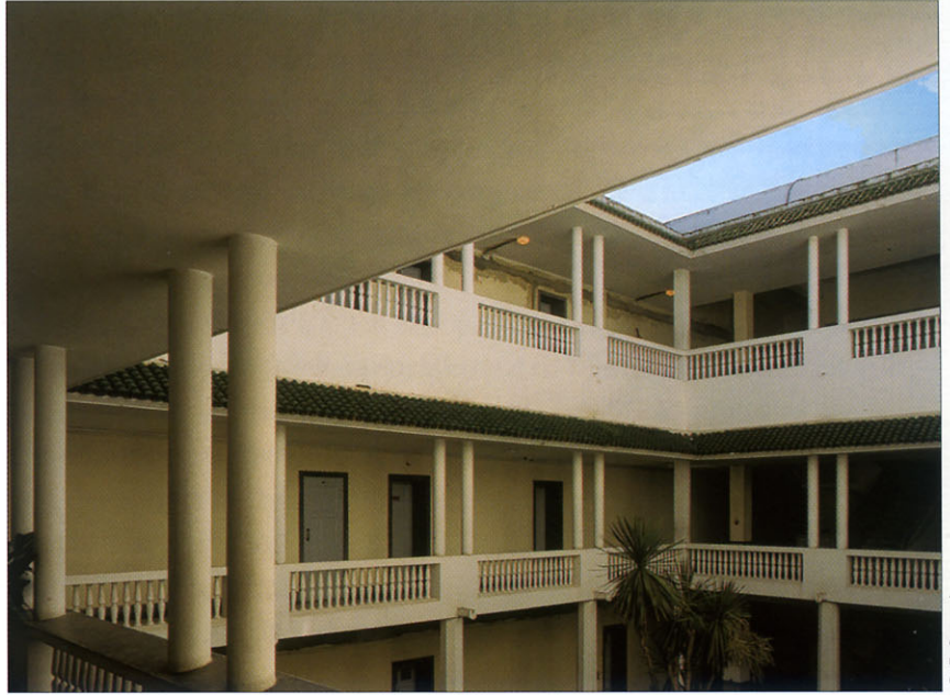
Rabat, galeries étagées sur le patio aménagé en jardin.